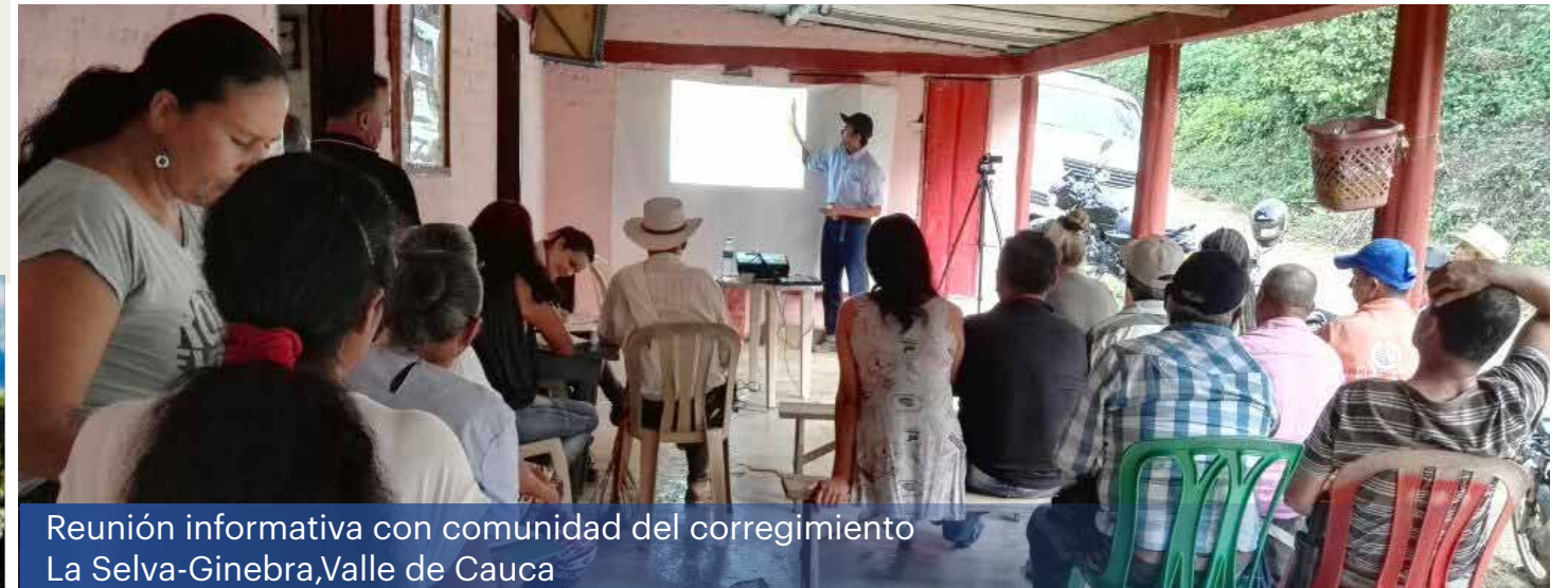
Reunión informativa con comunidad del corregimiento La Selva-Ginebra, Valle de Cauca

El Grupo Energía Bogotá (GEB) viene vinculándose con los departamentos de Risaralda, Caldas y Valle del Cauca a través de la construcción y operación de la línea de transmisión a 500 kV Refuerzo Suroccidental (La Virginia - Alférez y Alférez - San Marcos), para contribuir con el desarrollo de la región, el acceso y mejor calidad este servicio público esencial para el crecimiento de todos.