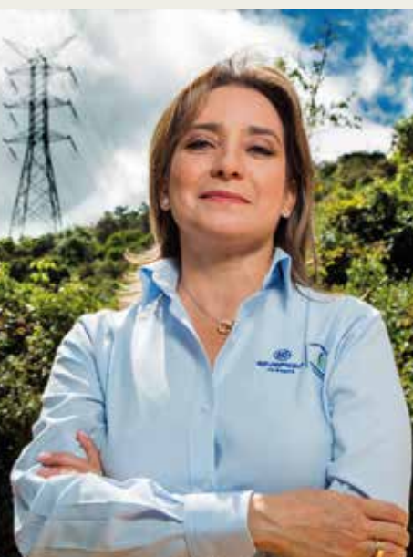
Astrid Álvarez Presidenta GEB

Sin embargo, para alcanzar este objetivo debemos trabajar todos de la mano . Es necesario el apoyo del gobierno, del sector privado, pero muy especialmente de las comunidades. Si no hay un trabajo en conjunto será muy difícil mejorar la calidad de vida de los habitantes que han estado marginados del progreso. Y la energía eléctrica es un paso para comenzar a superar ese atraso.